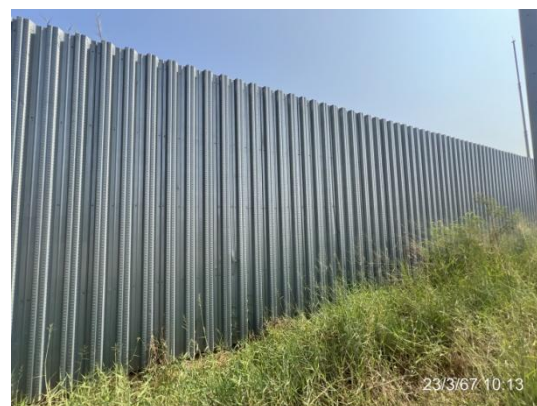
รูปที่ 3-30 ขอบเขตพื้นที่และแนวรั้วบริเวณพื้นที่ก่อสร้าง