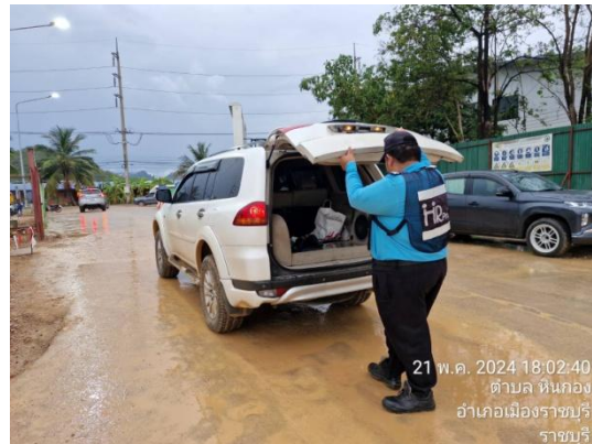
รูปที่ 3-26 เจ้าหน้าที่รักษาความปลอดภัยบริเวณทางเข้า-ออกของโครงการ