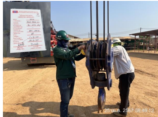
รูปที่ 3-9 สติ๊กเกอร์แสดงการตรวจสอบเครื่องจักร