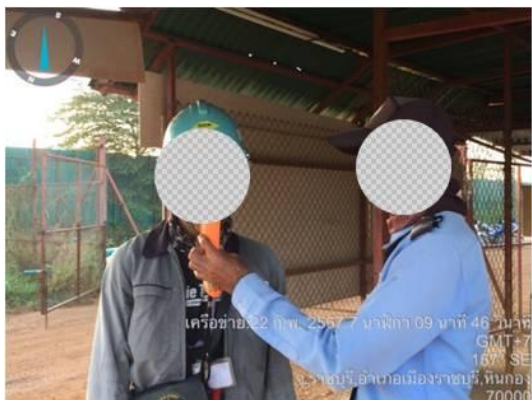
รูปที่ 3-41 การสุ่มตรวจสิ่งเสพติดและแอลกอฮอล์