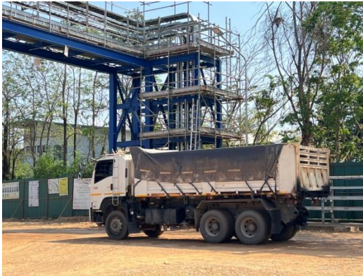
รูปที่ 3-6 การใช้ผ้าใบคลุมรถบรรทุก วัสดุอุปกรณ์การก่อสร้าง