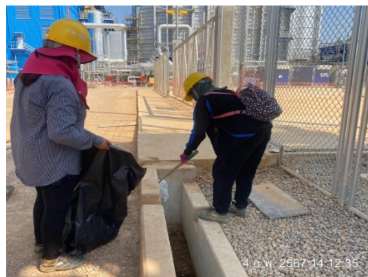
รูปที่ 3-21 การตรวจสอบและทำความสะอาด รางระบายน้ำ

ภาพถ่ายประกอบการปฏิบัติตามมาตรการป้องกันและแก้ไขผลกระทบสิ่งแวดล้อม