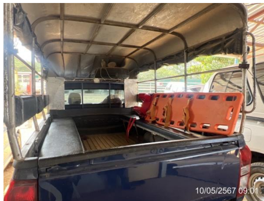
รูปที่ 3-35 รถรับส่งกรณีเกิดเหตุฉุกเฉิน