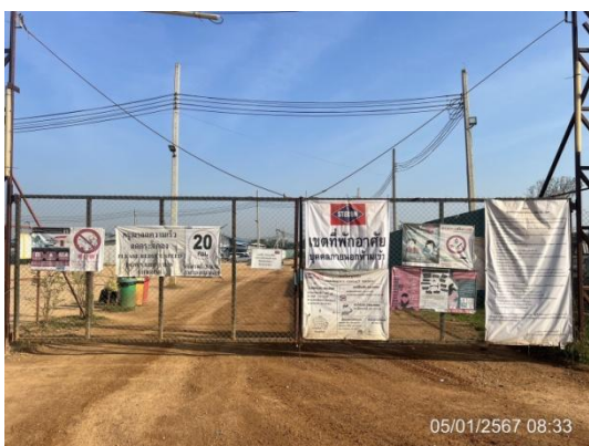
รูปที่ 3-42 การติดกฎระเบียบ บริเวณที่พักคนงานชั่วคราว