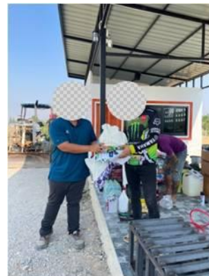
รูปที่ 3-3 ตัวอย่างการประชาสัมพันธ์โครงการ

ภาพถ่ายประกอบการปฏิบัติตามมาตรการป้องกันและแก้ไขผลกระทบสิ่งแวดล้อม