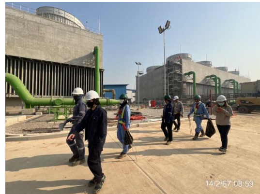
รูปที่ 3-29 การเดินตรวจสอบสภาพความปลอดภัย ในการทำงานของพนักงาน