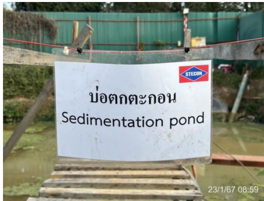
รูปที่ 3-28 บ่อดกตะกอนน้ำชั่วคราว ภายในพื้นที่โครงการ