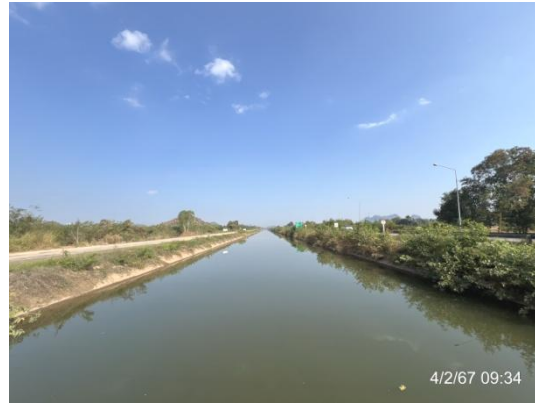
รูปที่ 3-17 น้ำในภายในพื้นที่โครงการ