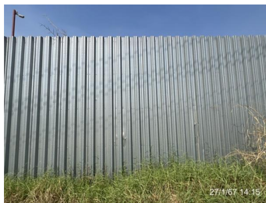
รูปที่ 3-13 กำแพงกันเสียงชั่วคราวบริเวณบ้านหลังโรงไฟฟ้า (ด้านทิศใต้ของโครงการ)