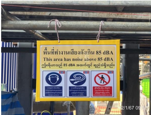
รูปที่ 3-16 ป้ายสัญลักษณ์ให้สวมใส่อุปกรณ์ ป้องกันเสียงบริเวณที่มีเสียงดัง