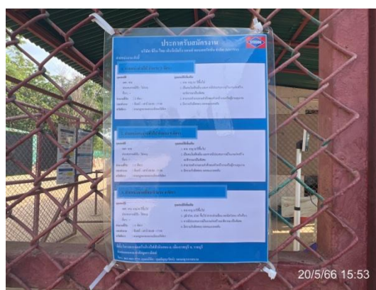
รูปที่ 3-45 การติดประกาศการรับสมัครงาน