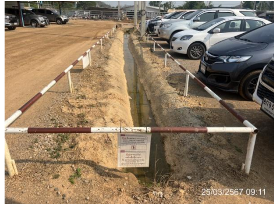
รูปที่ 3-27 รางระบายน้ำภายในพื้นที่โครงการ

ภาพถ่ายประกอบการปฏิบัติตามมาตรการป้องกันและแก้ไขผลกระทบสิ่งแวดล้อม