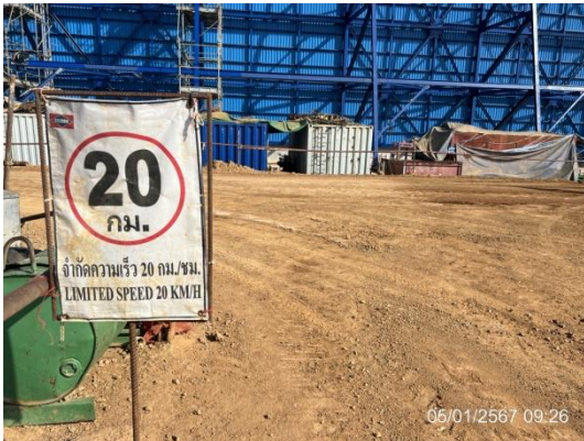
รูปที่ 3-8 ป้ายจำกัดความเร็วรถ ไม่เกิน 20 กิโลเมตรต่อชั่วโมง