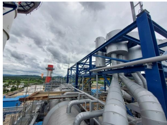
รูปที่ 3-48 อุปกรณ์ลดเสียง (Silencer) ขณะทดสอบเครื่องจักร (Commissioning)

ภาพถ่ายประกอบการปฏิบัติตามมาตรการป้องกันและแก้ไขผลกระทบสิ่งแวดล้อม