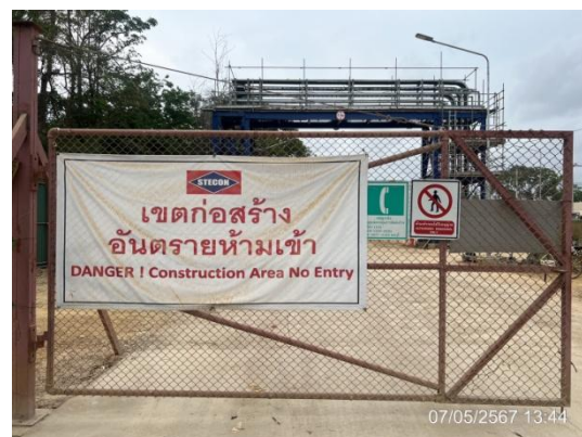
รูปที่ 3-31 ป้ายเตือนอันตรายบริเวณพื้นที่ก่อสร้าง

ภาพถ่ายประกอบการปฏิบัติตามมาตรการป้องกันและแก้ไขผลกระทบสิ่งแวดล้อม