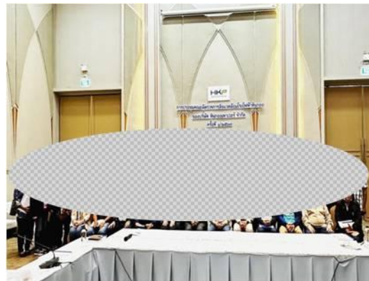
รูปที่ 3-47 การประชุมคณะผู้ตรวจการสิ่งแวดล้อม