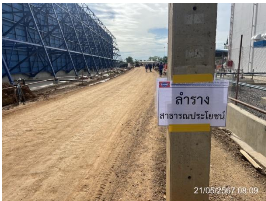
รูปที่ 3-4 การปักป้ายและทำสัญลักษณ์แสดง ขอบเขตพื้นที่สาธารณประโยชน์