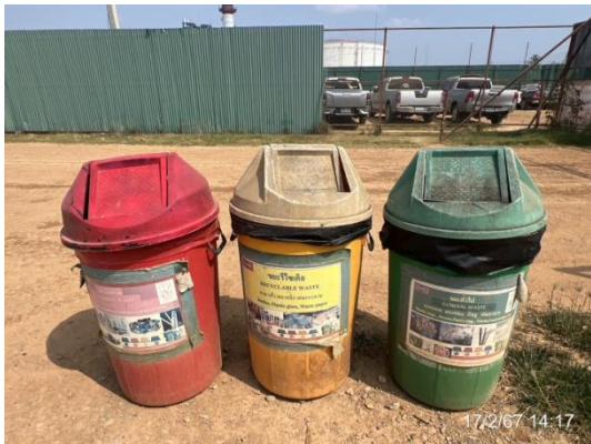
รูปที่ 3-39 การจัดการกากของเสีย บริเวณที่พักคนงานชั่วคราว