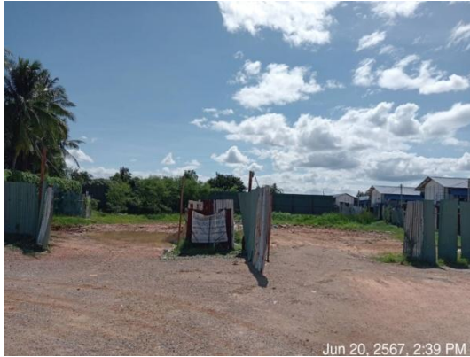
รูปที่ 3-22 พื้นที่จัดเก็บวัสดุก่อสร้าง