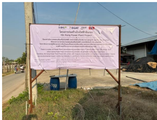
รูปที่ 3-3 ตัวอย่างการประชาสัมพันธ์โครงการ (ต่อ)