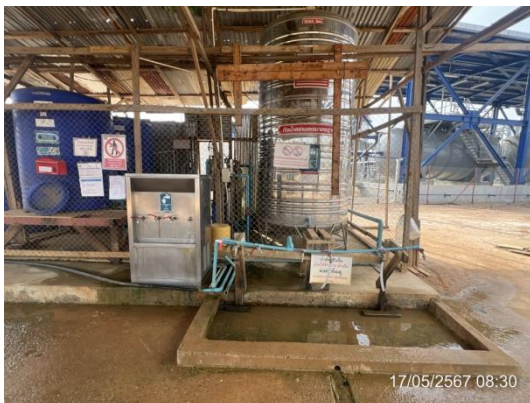
รูปที่ 3-18 น้ำดื่มสะอาดสำหรับคนงาน