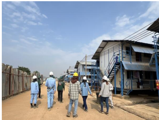
รูปที่ 3-40 การตรวจติดตามที่พักคนงานชั่วคราว