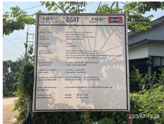
รูปที่ 3-2 ป้ายแสดงรายละเอียดโครงการ