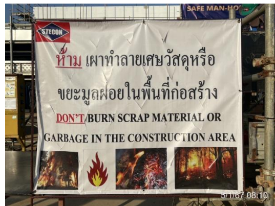
รูปที่ 3-11 ป้ายเตือนห้ามเผาทำลายเศษวัสดุ หรือขยะมูลฝอย

ภาพถ่ายประกอบการปฏิบัติตามมาตรการป้องกันและแก้ไขผลกระทบสิ่งแวดล้อม