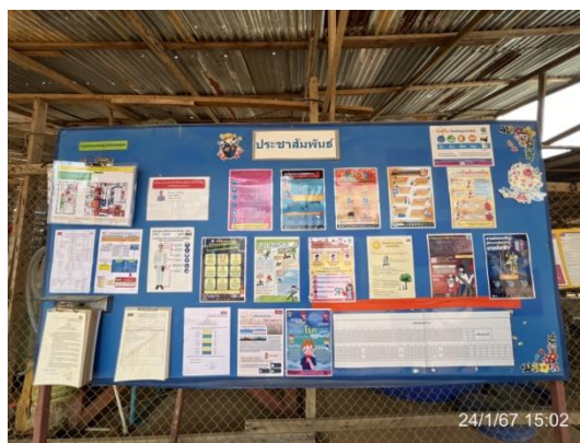
รูปที่ 3-36 การให้ความรู้เกี่ยวกับสุขอนามัย