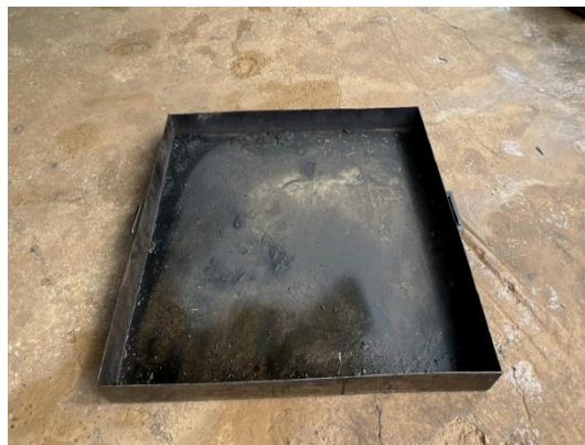
รูปที่ 3-44 พื้นที่ซ่อมบำรุงเครื่องจักร