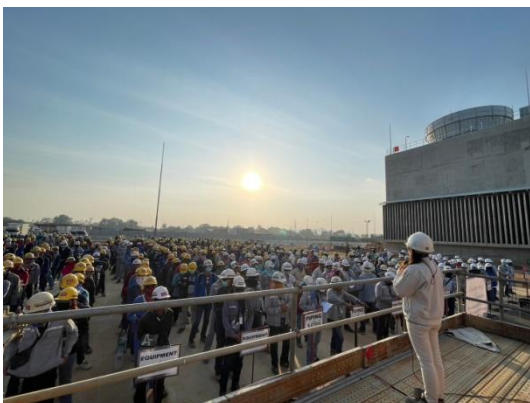
รูปที่ 3-10 การประชุมก่อนเริ่มทำงาน (Tool Box Talk Meeting)