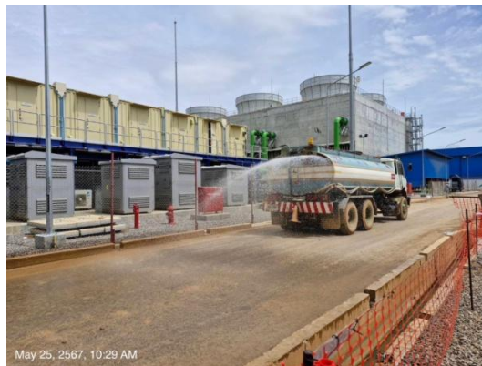
รูปที่ 3-5 การฉีดพรมน้ำภายในพื้นที่โครงการ

ภาพถ่ายประกอบการปฏิบัติตามมาตรการป้องกันและแก้ไขผลกระทบสิ่งแวดล้อม