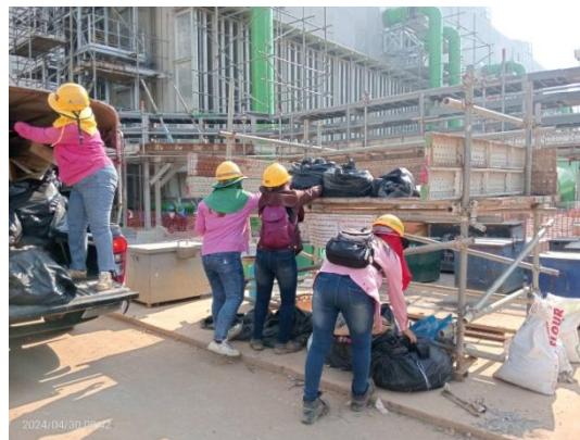
รูปที่ 3-12 การเก็บกวาดทำความสะอาดเศษวัสดุและกากของเสียในพื้นที่ก่อสร้าง