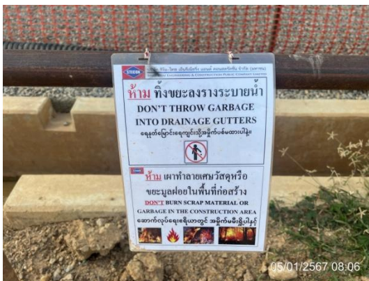
รูปที่ 3-20 ป้ายห้ามทิ้งขยะมูลฝอย ลงรางระบายน้ำ