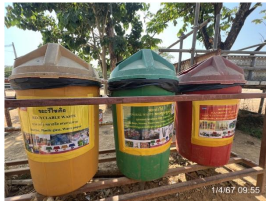
รูปที่ 3-23 ภาชนะรองรับมูลฝอยที่มีฝาปิดมิด