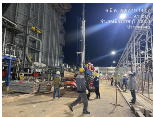
รูปที่ 3-43 ไฟส่องสว่างขณะปฏิบัติงานกลางคืน

ภาพถ่ายประกอบการปฏิบัติตามมาตรการป้องกันและแก้ไขผลกระทบสิ่งแวดล้อม