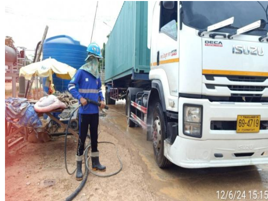
รูปที่ 3-7 การทำความสะอาดล้อรถบรรทุก ก่อนออกจากบริเวณพื้นที่ก่อสร้าง