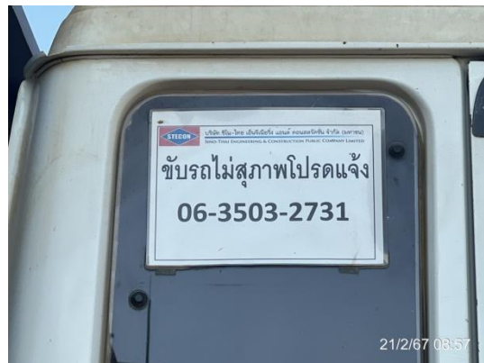
รูปที่ 3-25 การติดป้ายชื่อและเบอร์โทรศัพท์ลงบนรถขนส่ง