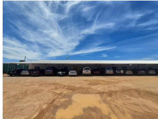
รูปที่ 3-1 ศูนย์รับเรื่องร้องเรียน