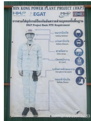
รูปที่ 3-32 ป้ายเตือนสวมใส่อุปกรณ์ป้องกันอันตรายส่วนบุคคล