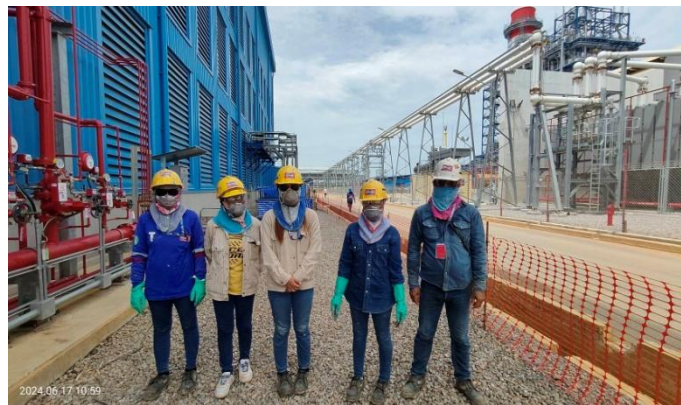
รูปที่ 3-33 คนงานสวมใส่อุปกรณ์ป้องกันอันตรายส่วนบุคคล