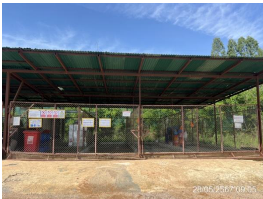
รูปที่ 3-24 พื้นที่รวบรวมกากของเสียแยกประเภท พร้อมป้ายระบุชนิดเงิน