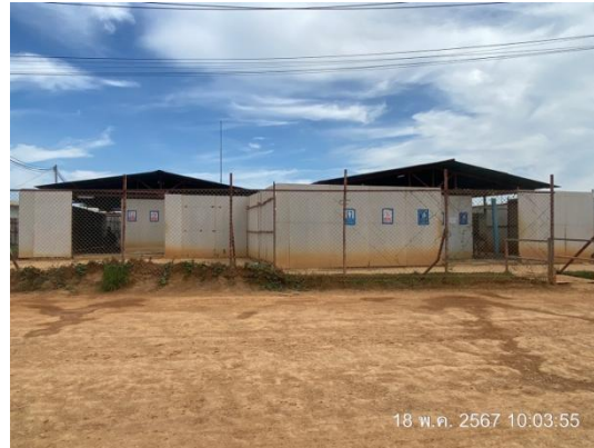
รูปที่ 3-19 ห้องสุขาที่มีถังเก็บสิ่งปฏิกูล และถูกสุขลักษณะ