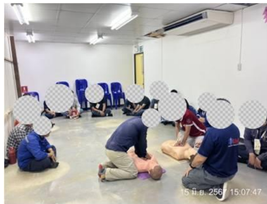
รูปที่ 3-46 การอบรมปฐมพยาบาลเบื้องต้น (First Aid)

ภาพถ่ายประกอบการปฏิบัติตามมาตรการป้องกันและแก้ไขผลกระทบสิ่งแวดล้อม